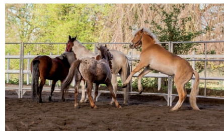
Module compétences équines Décoder le langage des chevaux. Les différents types de personnalités des chevaux. Pratiquer l'accompagnement en sécurité.