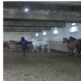
Module 1 6 exercices fondamentaux EAHAÉ. Les bases pour commencer à pratiquer.

* Certification de droit privé, non enregistrée à la CNCP.