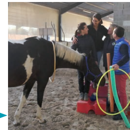
Module 3 Travailler avec des équipes. Concevoir un programme.