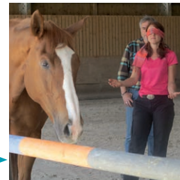
Module 2 Les 4 composantes de l'IE. Développer son IE.