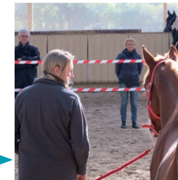
Module 4 Accompagner avec l'AI. S'entraîner à animer.