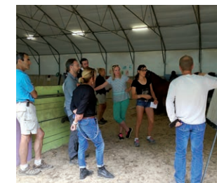
Supervision Échanger sur votre pratique.